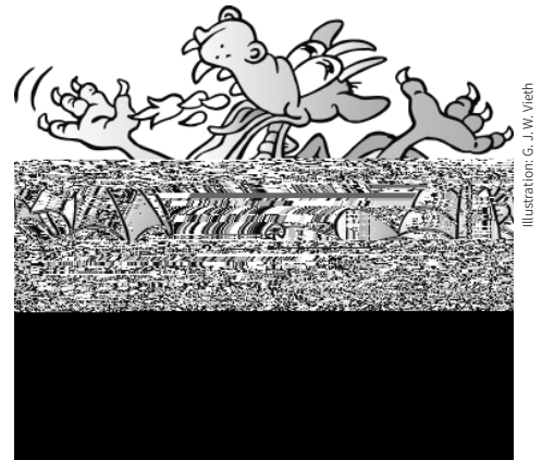
Illustration: G. J.W. Vieth

Da es für die meisten Schülerinnen und Schüler das erste Mal war, ein eigenes Gedicht zu schreiben, habe ich zunächst ein „Gedichtskelett“ in verschiedenen Schwierigkeitsstufen ( M4 ) zur Verfügung gestellt. Vie-