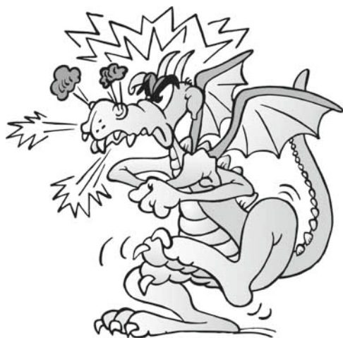
Illustration: G. J. W. Vieth

stellten sie so auf Dauer, dass sich eigentlich niemand mehr richtig entfalten konnte. Gerade in der Feststellung, dass es (legitime) Unterschiede darin gibt, wie Gefühle ausgelebt werden und welche Bedürfnisse jemand hat, liegt aber auch eine Chance, sich mit der besonderen Situation auseinanderzusetzen und etwas über eigene und fremde Gefühle und Bedürfnisse zu lernen, das über die Pandemie hinausreicht.